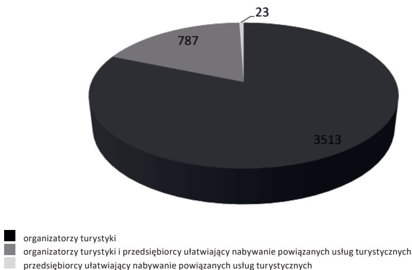
Ryc. 28. Struktura działalności na rynku turystycznym