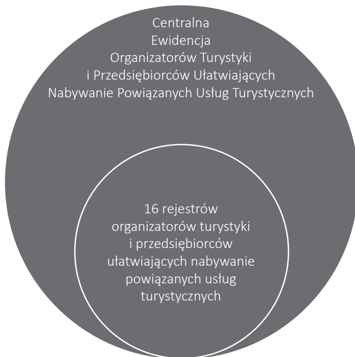
Ryc. 32. Ewidencja i rejestry OTiPUNPUT